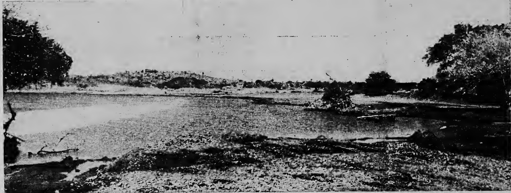
Kantu di cimbra di linea di costa di St. Jorishaai lo resucita e beach largu artificial. Esaki ta bira alavez centruman dje beach, cu bishitantenan ta mira prome na yegada.